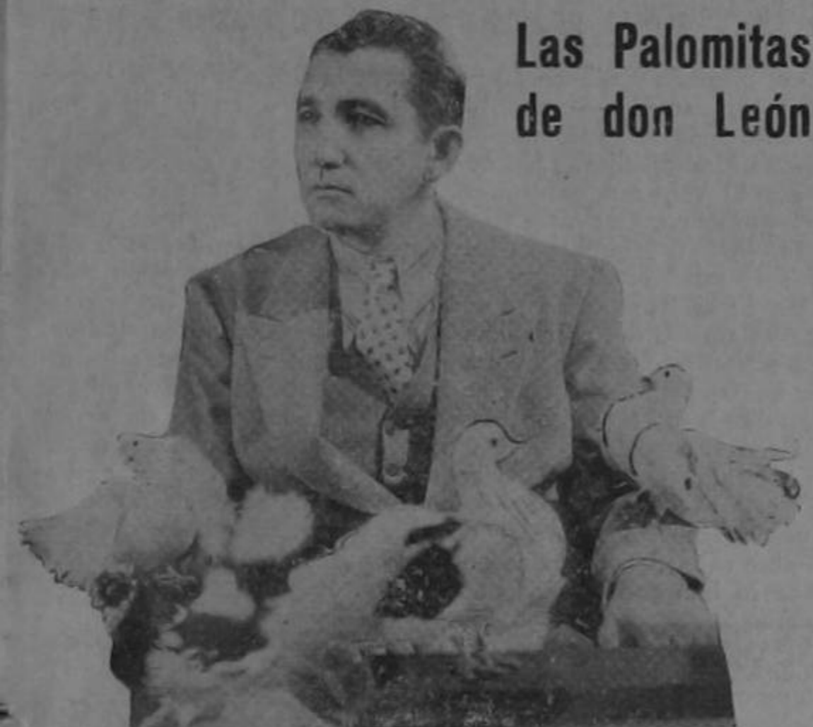
Las Palomitas de don León